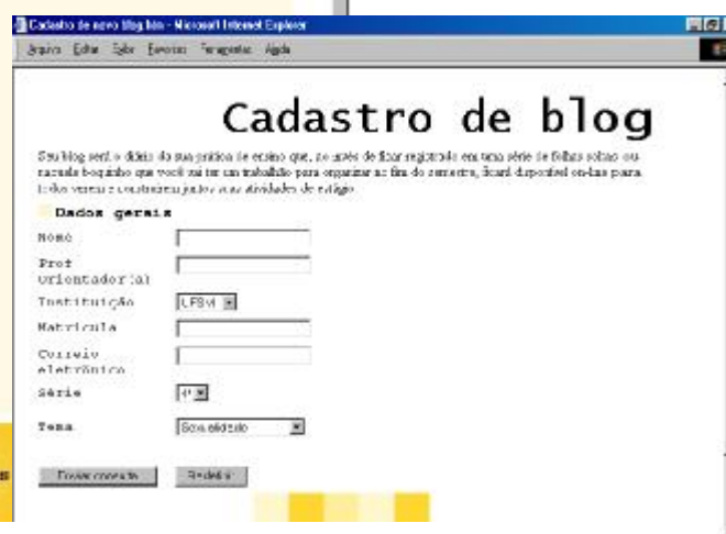
Fig 3. Sistema de cadastro