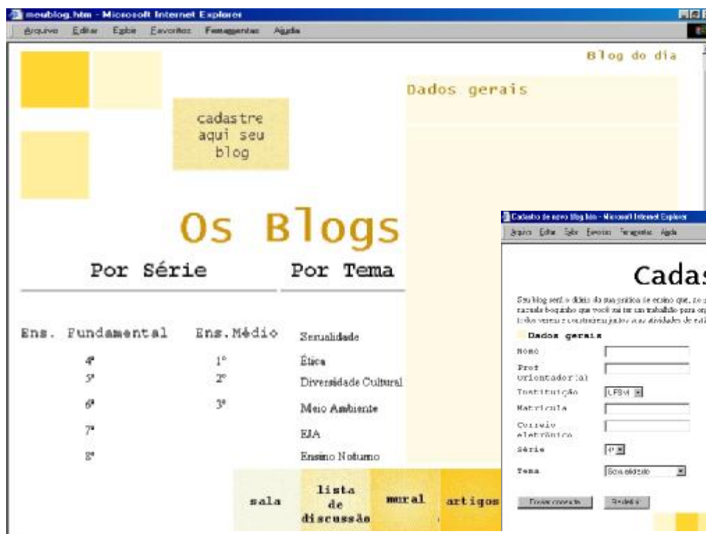
Fig 2. Sistema de Blogs: categorias e destaque